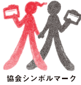
協会シンボルマーク